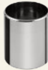
Rundbehälter Plastik (5, 5l) ca. 72 Kugeln oder Edelstahl (7l) ca. 90 Kugeln