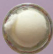
Sizilianische Zitrone oder Himbeer-Minze