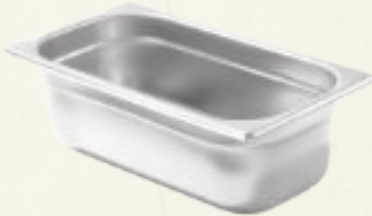
längliche Schale (5l) ca. 65 Kugeln